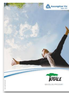
Protection Totale Total Protection