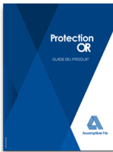
Protection Or Golden Protection