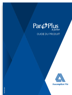
ParPlus & ParPlus Junior