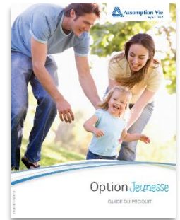
Option Jeunesse Youth Plus