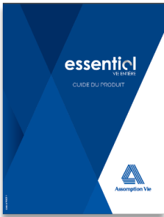
Essentiel vie entière Essential Whole Life