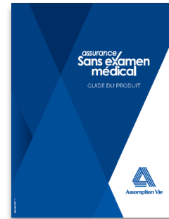
Assurance sans examen médical/ No medical